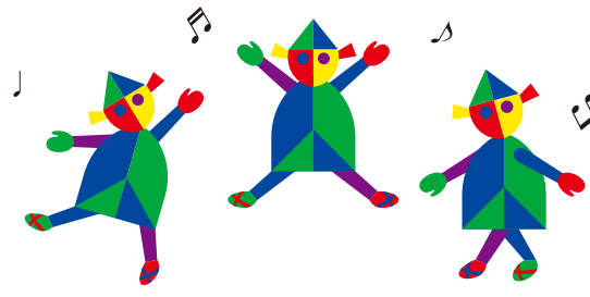
三田少年少女合唱団 chorus

大阪教育大学、同大学院修了。フルート及び児童合唱の指導者。日本クラシック音楽協会より優秀指導者賞。関西21世紀交響楽団常任指揮者。日本クラシック音楽コンクール全国大会審査員。