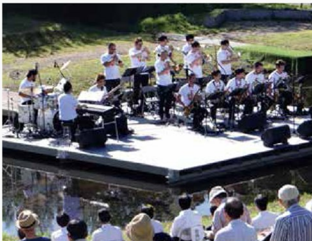
風ミュ・ジャズオーケストラ

トッププレーヤーを一堂に集めた、大阪ザ・シンフォニーホール・ビッグバンドの音楽監督でもあるスーパー・トランペッター。華やかな演奏活動のかたわら、学校教育や被災地支援活動にも力を入れている。